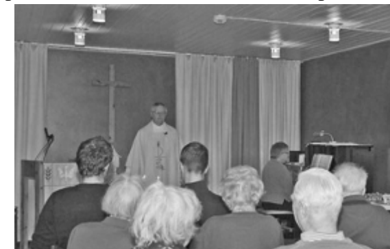
Timoteusmessene er biskopens menighet.

«Timoteusmessene» som mottaker, står nå på den nyopprettede listen. Får du bladet på gudstjenesten, legger giroen i bladet. Setter du inn et lite beløp på giroen vil du bli ført på lista. Du får da bladet i posten og er regnet blant menighetens givere. Tusen takk. AAA